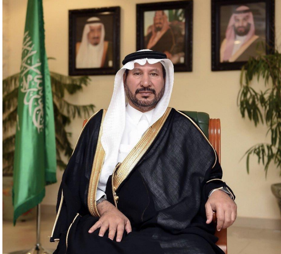
سعادة امين منطقة القصيم امين مجلس المرصد الحضري لمنطقة القصيم المهندس / محمد بن مبارك المجلي