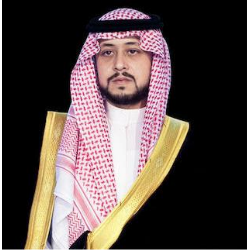
صاحب السمو الملكي نائب امير منطقة القصيم الأمير / فهد بن تركي بن فيصل بن تركي بن عبد العزيز