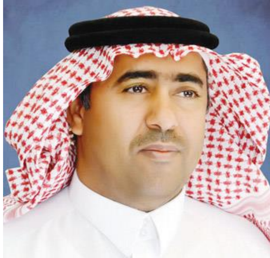
سعادة رئيس بلدية محافظة المذنب - المهندس/عبداللطيف بن حمد الخطيب نائب رئيس اللجنة التنفيذية للمركز الحضري لحاضرة المذنب