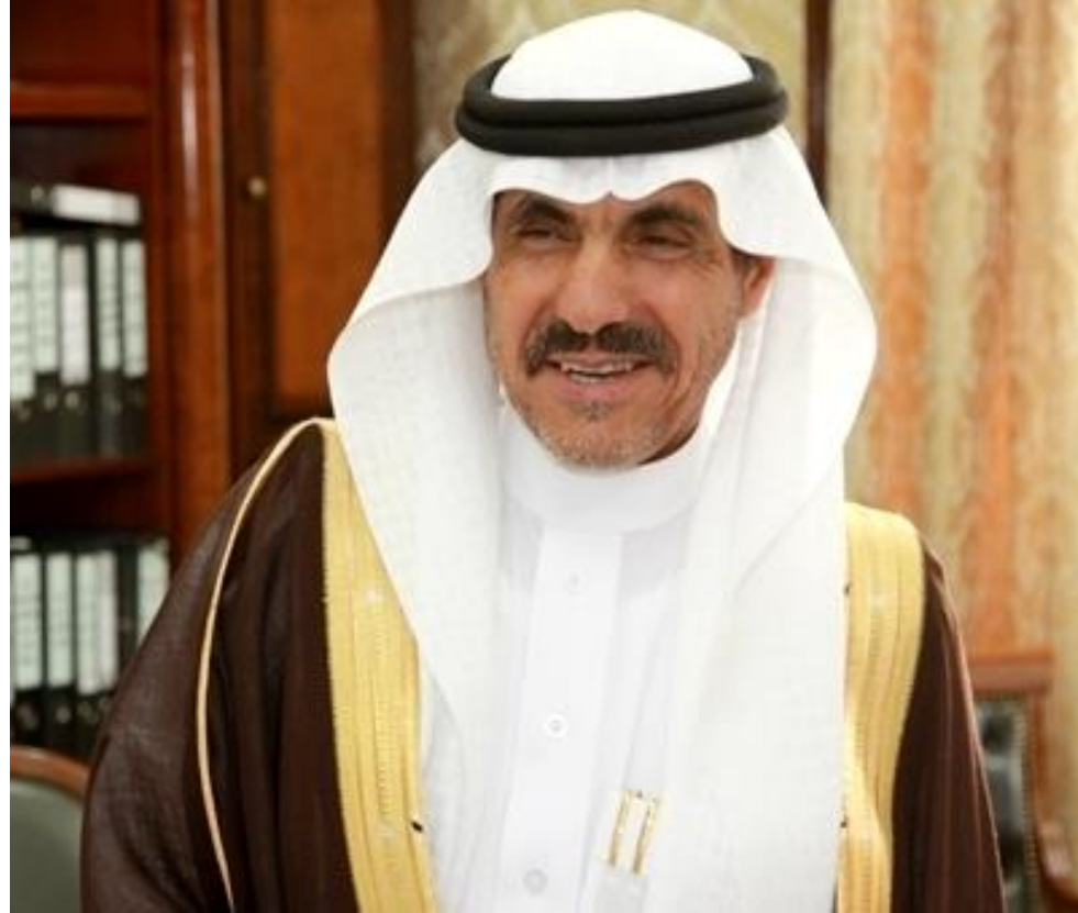
سعادة محافظ المذنب - الاستاذ/سليمان بن محمد التويجري رئيس اللجنة التنفيذية للمركز الحضري لحاضرة المذنب