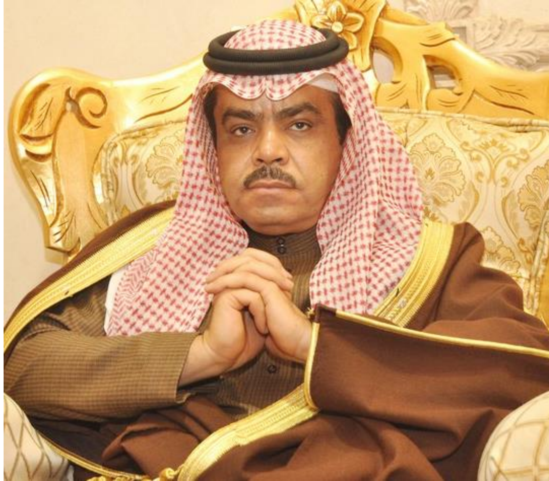
سعادة محافظ الرس - الاستاذ/ محمد بن عبدالله العساف رئيس اللجنة التنفيذية للمركز الحضري لحاضرة الرس